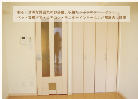
明るく清潔な雰囲気のお部屋、収納たっぷりのクローゼット ペット専用ドア・エアコン・モニターインターホンが部屋内に設置