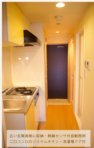
広い玄関両側に収納・熱線センサー付自動照明 二口コンロのシステムキッチン・洗濯場ドア付