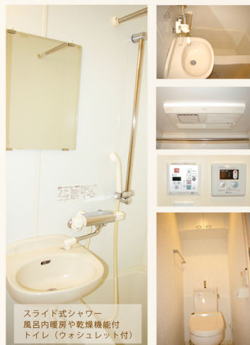
スライド式シャワー 風呂内暖房や乾燥機能付 トイレ(ウォシュレット付)