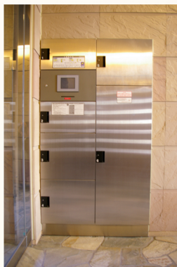
留守の時でも宅配を受け取れる宅配ボックス・自動ドアの横にはペット用足洗い湯まであり、散歩も楽々とも便利。