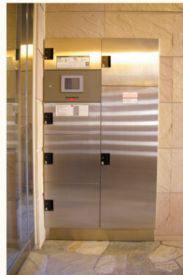
留守の時でも宅配を受け取れる宅配ボックス・自動ドアの横にはペット用足洗い湯まであり、散歩も楽々とても便利。