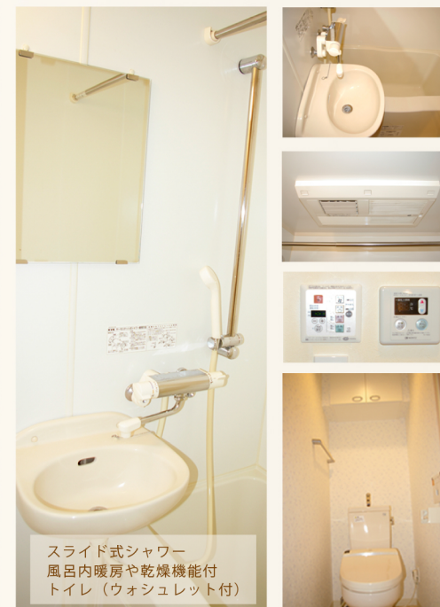
スライド式シャワー 風呂内暖房や乾燥機能付 トイレ (ウォシュレット付)